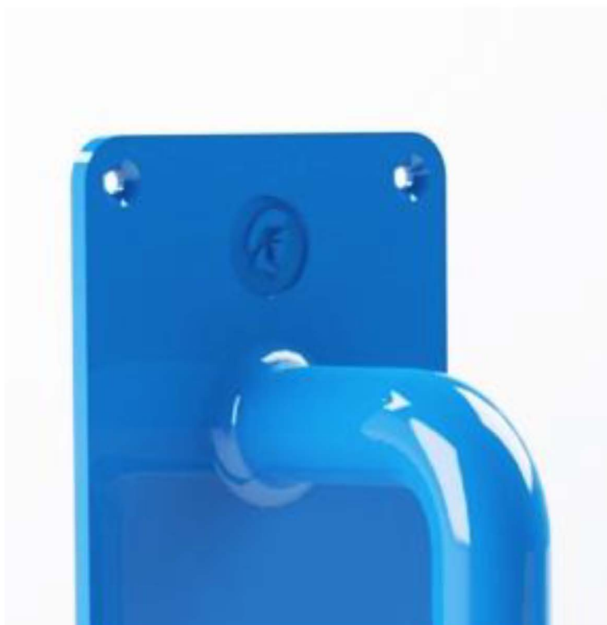
Logo SteriCore znajduje się na górze szyldu.