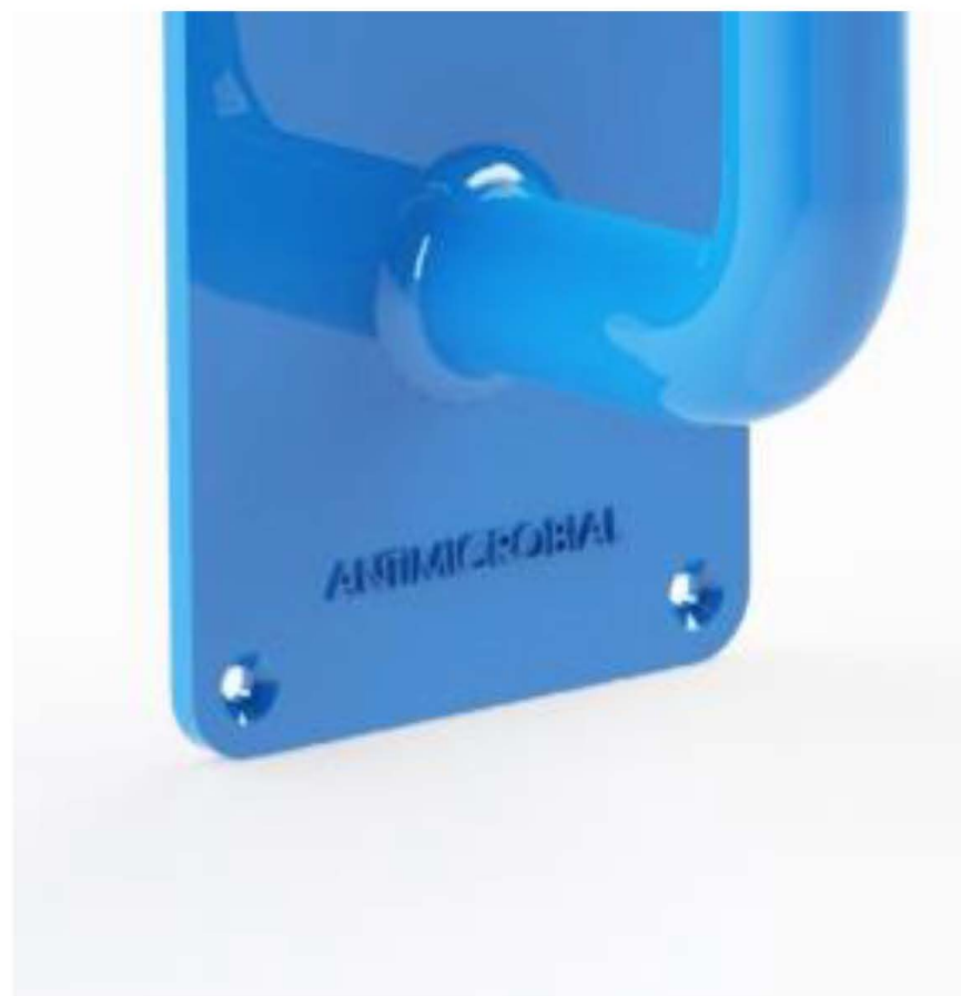
Słowo „antybakteryjny” zostało umieszczone na dole szyldu.